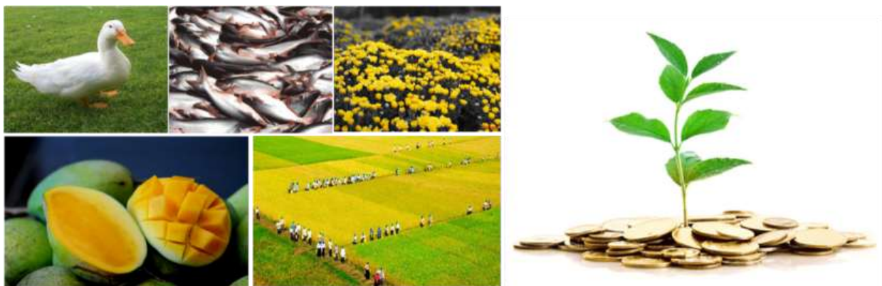
Các sản phẩm chủ lực của nông nghiệp Đồng Tháp