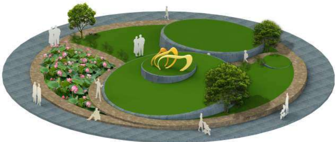
Phối cảnh một công trình biểu tượng cho huyện Cao Lãnh gắn liền với hình ảnh Xoài Cao Lãnh