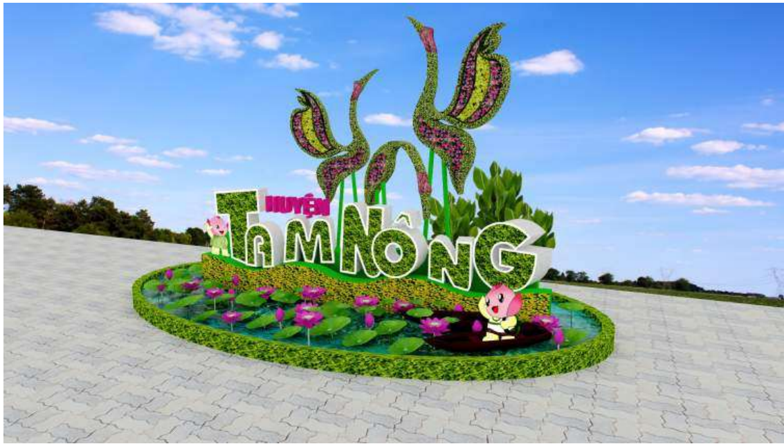
Biểu tượng mang hình ảnh chim sẽ tạo điểm nhấn nhận diện cho huyện Tam Nông