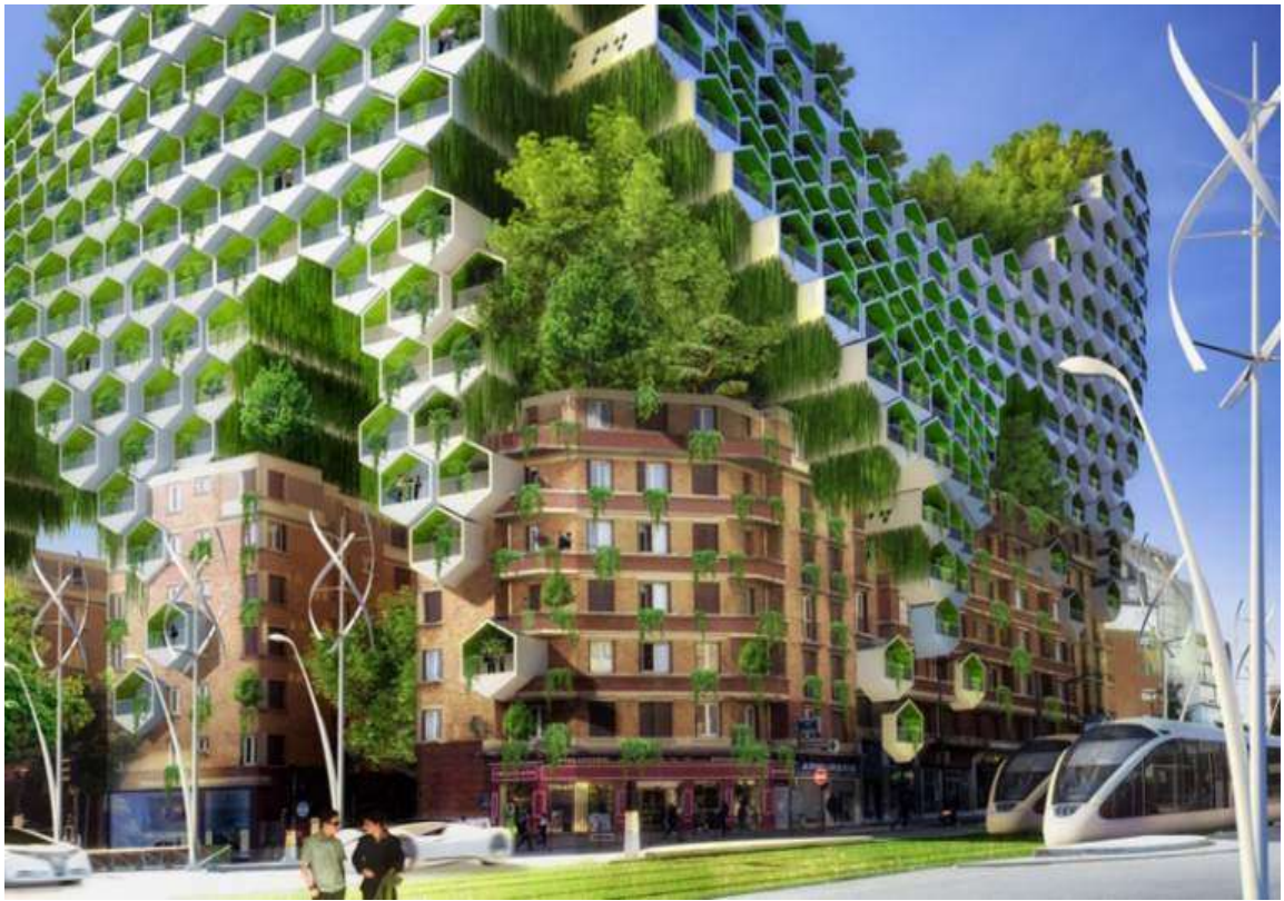
Phối cảnh một công trình tiêu biểu cho kiến trúc đô thị Xanh