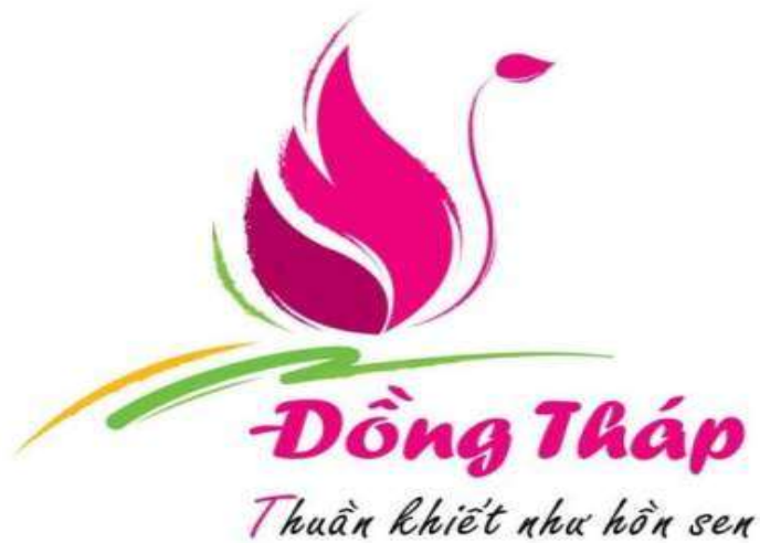
Logo du lịch Đồng Tháp

xanh thiên nhiên trong lành cùng màu vàng của văn hóa tâm linh thuần khiết. Toàn thể logo muốn truyền tải thông điệp quảng bá của du lịch Đồng Tháp: “ Thuần khiết như hồn sen ”.