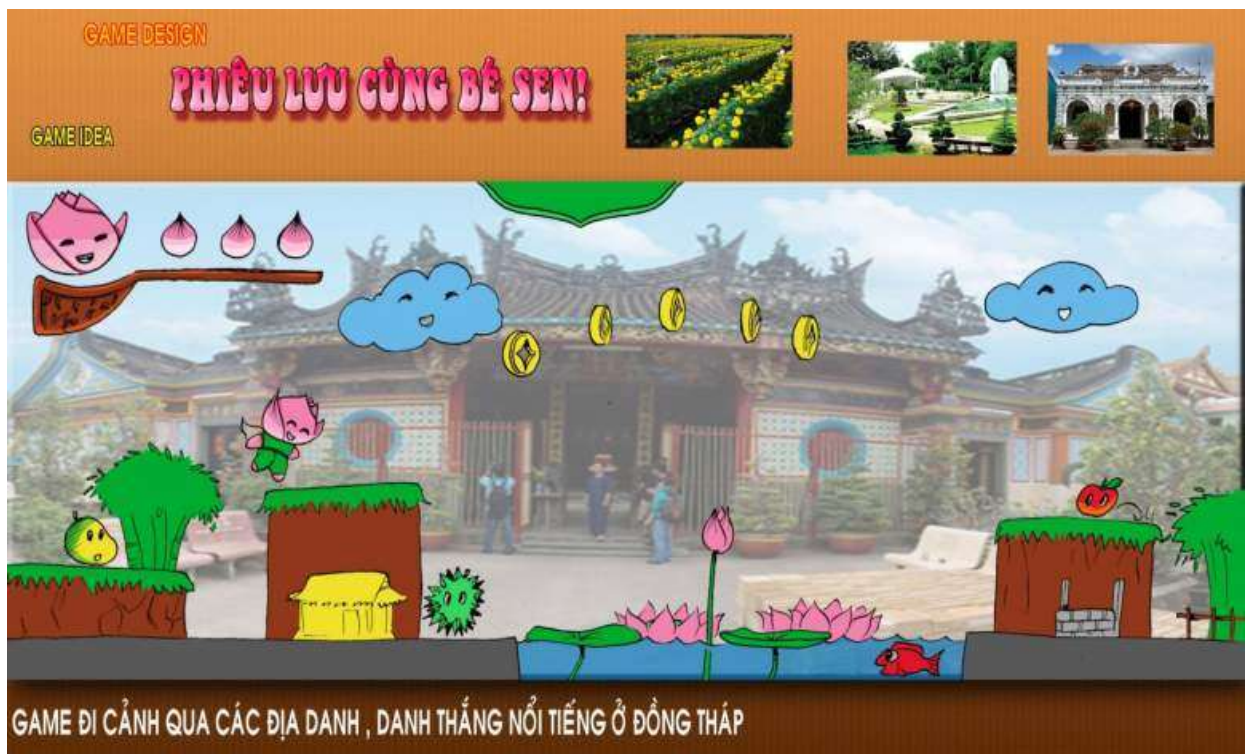
Giao diện trò chơi “Phiêu lưu cùng Bé Sen”