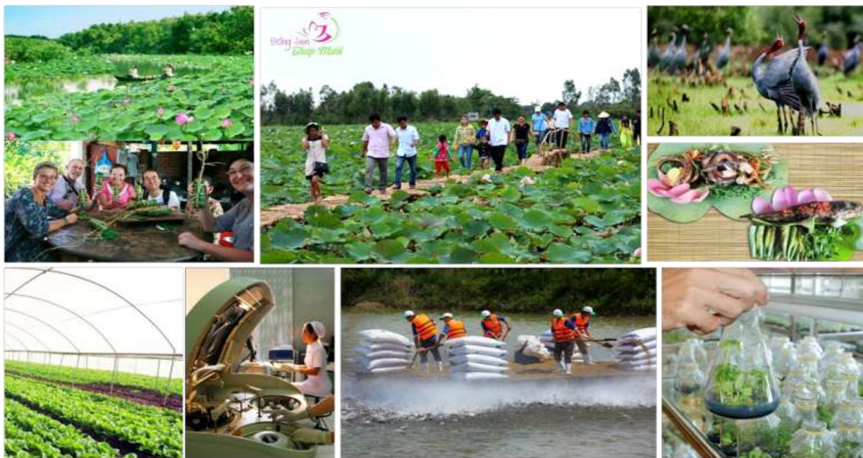
Hình ảnh định vị cho tỉnh Đồng Tháp đến năm 2020

Đồng Tháp trở thành một trong những tỉnh đi đầu trong khu vực ĐBSCL về phát triển nông nghiệp theo hướng ứng dụng khoa học, kỹ thuật và công nghệ vào sản xuất, chăn nuôi. Các mô hình sản xuất sạch, sản xuất an toàn sẽ được đề cao và đưa vào triển khai thực hiện trên diện rộng. Từ đây sản phẩm nông nghiệp được kiểm nghiệm, đánh giá, giám sát chặt chẽ chất lượng theo qui trình khép kín. Các sản phẩm nông nghiệp có xuất xứ từ Đồng Tháp được gắn tem “Made in Dong Thap” sẽ xuất hiện trên thị trường như một sự cam kết, đảm bảo về chất lượng và độ an toàn.