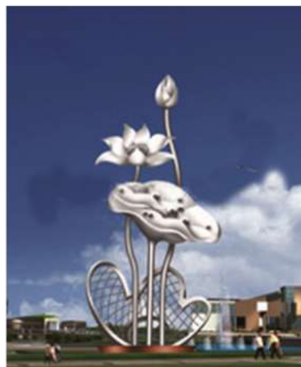
Biểu tượng Sen tạo điểm nhấn, nhận diện cho địa phương