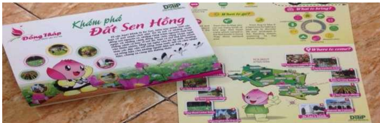
Hệ thống thông tin dạng infographics

Các thông tin cơ bản về kinh tế, du lịch và chính sách địa phương, các Đề án lớn, ... được thể hiện xúc tích, ấn tượng (có thể kết hợp với hình ảnh thân thiện của bé Sen để tạo sự gần gũi).