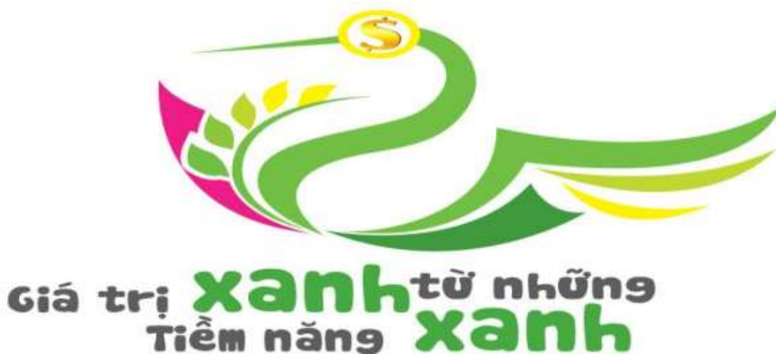
Logo quảng bá Nông nghiệp Đồng Tháp

Biểu trưng (logo) được sáng tạo dựa trên hình ảnh các sản phẩm Nông nghiệp chủ lực và đầy tiềm năng phát triển của Đồng Tháp, phối hợp một cách tinh tế với 03 màu đặc trưng, nhận diện Đồng Tháp: xanh, vàng và hồng. Trong đó màu xanh được sử dụng chủ đạo để thể hiện những giá trị xanh (sản xuất sạch, an toàn, bền vững và sinh thái). Tổng thể logo đã truyền tải được những tinh thần cốt lõi của Nông nghiệp Đồng Tháp mà Đề án tái cơ cấu Nông nghiệp đã định vị: “Giá trị xanh từ những tiềm năng xanh”.