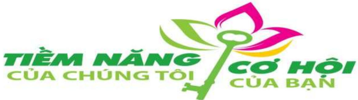
Logo quảng bá, thu hút đầu tư Đồng Tháp

Logo là sự kết hợp khéo léo hình ảnh gợi nhắc tới Đồng Tháp với phần nội dung khẩu hiệu truyền thông. Hình ảnh chiếc chìa khóa cơ hội từ Đất Sen Hồng trao tới tay các Nhà đầu tư trên nền xanh chủ đạo thể hiện những lợi thế, định hướng trọng điểm thu hút đầu tư của Đồng Tháp: Nông nghiệp và Du lịch. Và ở chính nơi đây, chính quyền là người bạn đồng hành, mở rộng cửa chào đón, sẵn sàng tạo điều kiện và luôn khẳng định “Tiềm năng của chúng tôi – cơ hội của bạn”