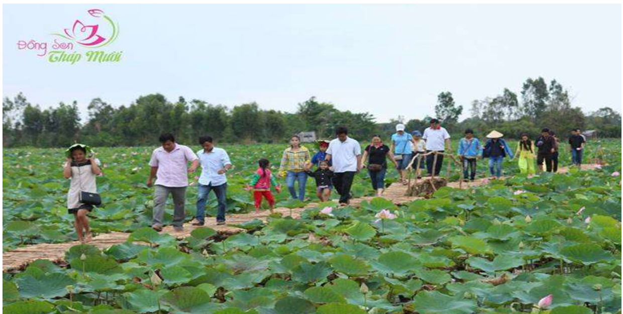
Mô hình du lịch cộng đồng tại KDL Đồng Sen Tháp Mười hút khách và tạo ra điểm sáng cho du lịch Đồng Tháp