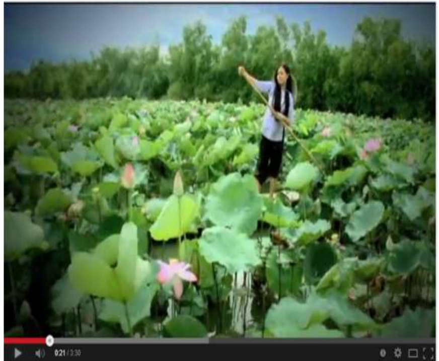
Mobile Apps “Thỏ Địa Đồng Tháp” cho hệ điều hành Adroid với ios và Clip quảng bá du lịch Đồng Tháp