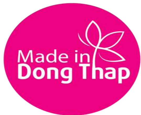
Mẫu biểu trưng sản phẩm “Made in Dong Thap”