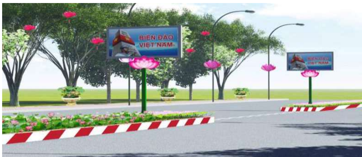
Pano tuyên truyền quảng cáo tại Tp. Cao Lãnh

- Xây dựng các quây thông tin du lịch tại các điểm tập trung đông du khách (Đã được đề cập trong Đề án phát triển du lịch tỉnh Đồng Tháp 2016-2020).